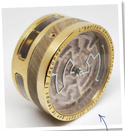
La pendulette "Héritage" réalisée pendant ma formation

Moi, je suis horloger et j'ai une spécialité en plus : je suis angleur . Cela consiste à casser et polir les angles vifs des minuscules pièces métalliques qui composent le mécanisme d'une montre.