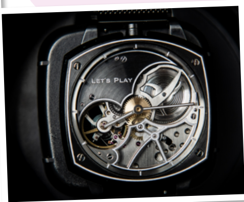
La montre "Let's play"

Mes études, après un bac technologique STI2D, ont duré 7 ans. J'ai d'abord obtenu un BMA (brevet des métiers d'art) et enfin un DNMADE en horlogerie.