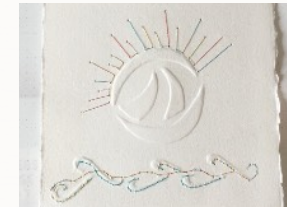
Embossage manuel, couture

Quoi de plus fascinant que de donner au papier la forme d'un dessin... le gaufrage à la presse ou en embossage est ludique et gratifiant, les enfants l'adorent... les adultes aussi !