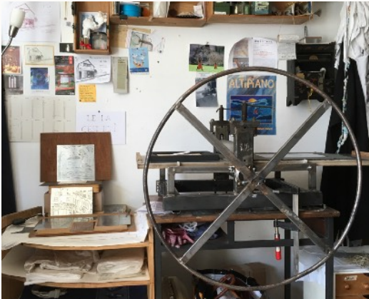
Presse taille douce, pièce unique conçue et réalisée par le sculpteur JieM Bourasseau

Artiste-auteur installée à Rennes depuis 2011 et passionnée d'estampe, Helena Gath pratique la gravure sur métal depuis 2013, et plus précisément l'eau-forte.