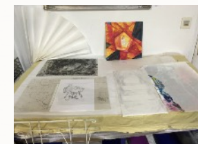
Table de travail...

Le choix du papier est un moment à la fois capital et délicieux. Les papiers de Moulins, papiers d'art et d'édition, les papiers japonais... Tous ont leurs qualités propres, je les adore et aime les faire découvrir à ceux qui ne les connaissent pas encore où qui aimeraient en savoir plus.