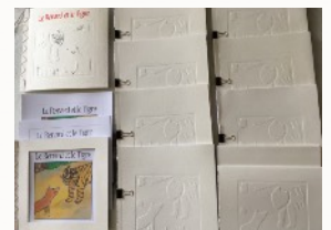
Gaufrages sur papier d'art